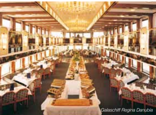
Galaschiff Regina Danubia