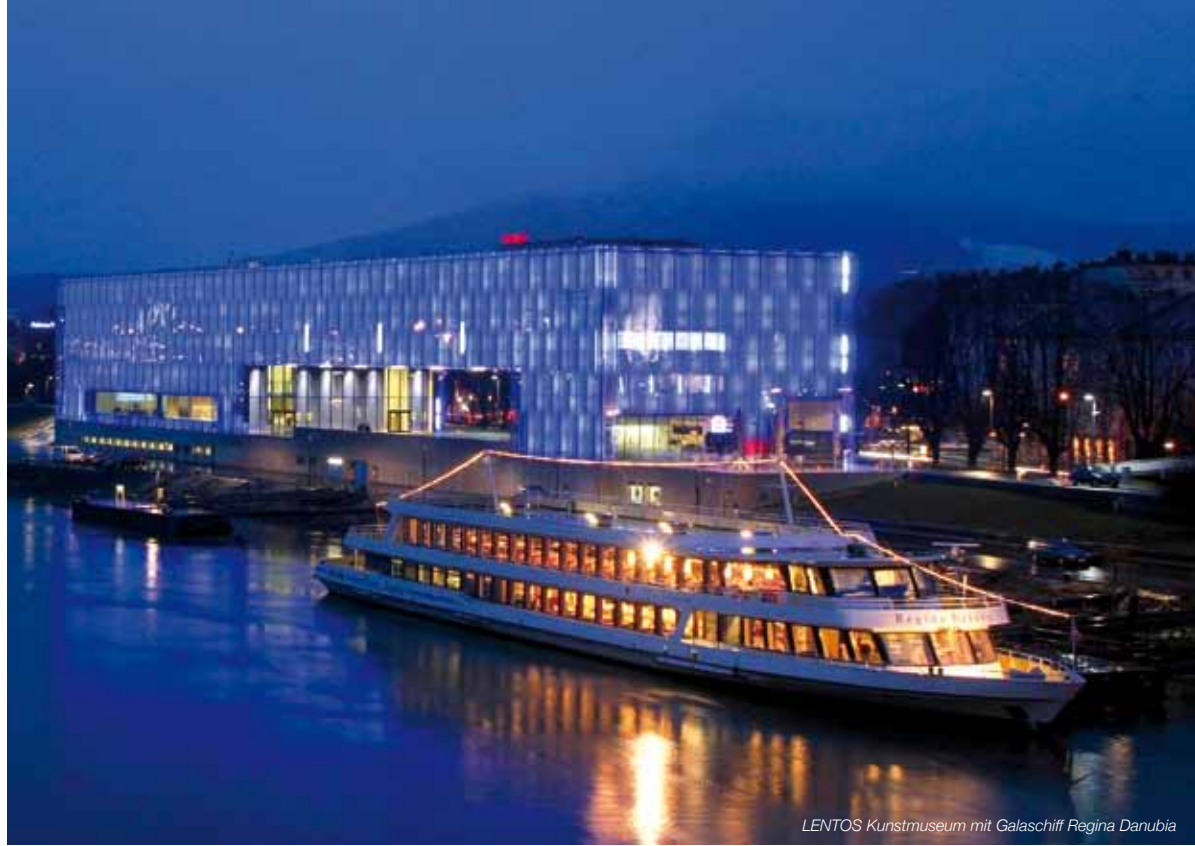
LENTOS Kunstmuseum mit Galaschiff Regina Danubia